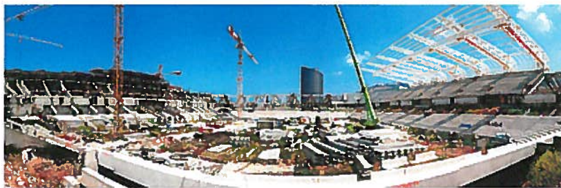
בניית אצטדיון סמי עופר. אותם אדריכלים כמו באצטדיונים באירופה