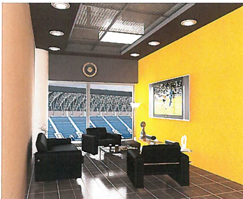
חדר וי.א.פי באצטדיון המושבה. יש גם כיבוד