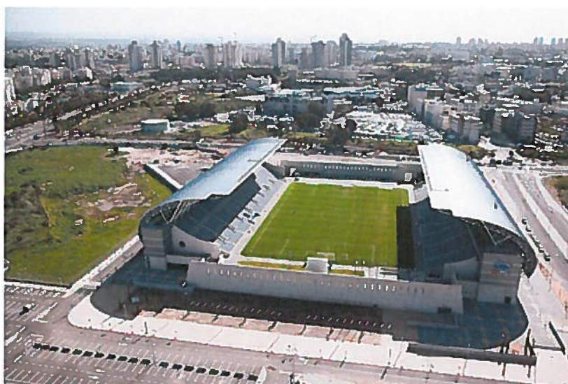
אצטדיון המושבה. יארח את מכבי תל-אביב

למרות מיקומו, יארח האצטדיון בעונה הקרובה את מכבי תל-אביב כקבוצת הבית של המקום, וזאת בשל שיפוצו של מגרש בלומפילד ביפו המצוי כעת בשלבי תכנון. אצטדיון המושבה מכיל כ-12 אלף מקומות בשתי טריבונות, וגם כאן קיימת אופציית הרחבה עתידית של היציעים, שיביאו את מספר הצופים ל-20 אלף.