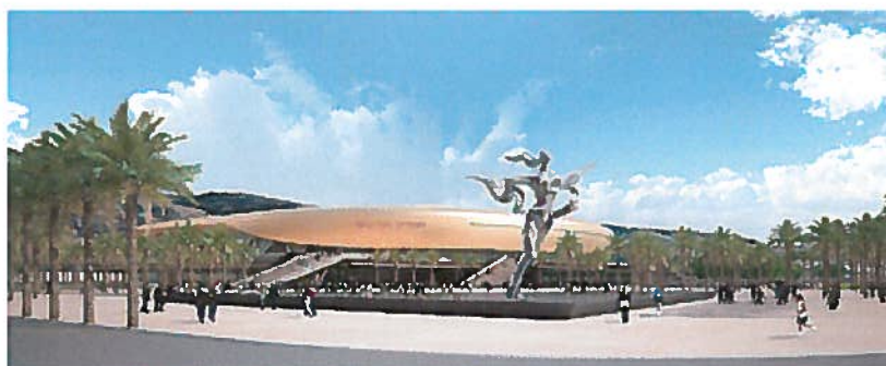
הדמיית אצטדיון סמי עופר בחיפה. גרנדיזי עם גג זהב

135 מיליון שקל מכלל הסכום המושקע בבניית האצטדיון הגיעו מקופת המועצה להסדר הימורים; 80 מיליון שקל נתרמו על ידי משפחת עופר; ו-120 מיליון שקל נוספים יגיעו ממכירת אצטדיון קריית אליעזר הישן ( שבמקומו יבנו בנייני מגורים ). עוד 80 מיליון שקל יגיעו ממכירת שטחי מסחר וחסיית באצטדיון ויתר הכספים יגיעו מהקופה הציבורית של עיריית חיפה.