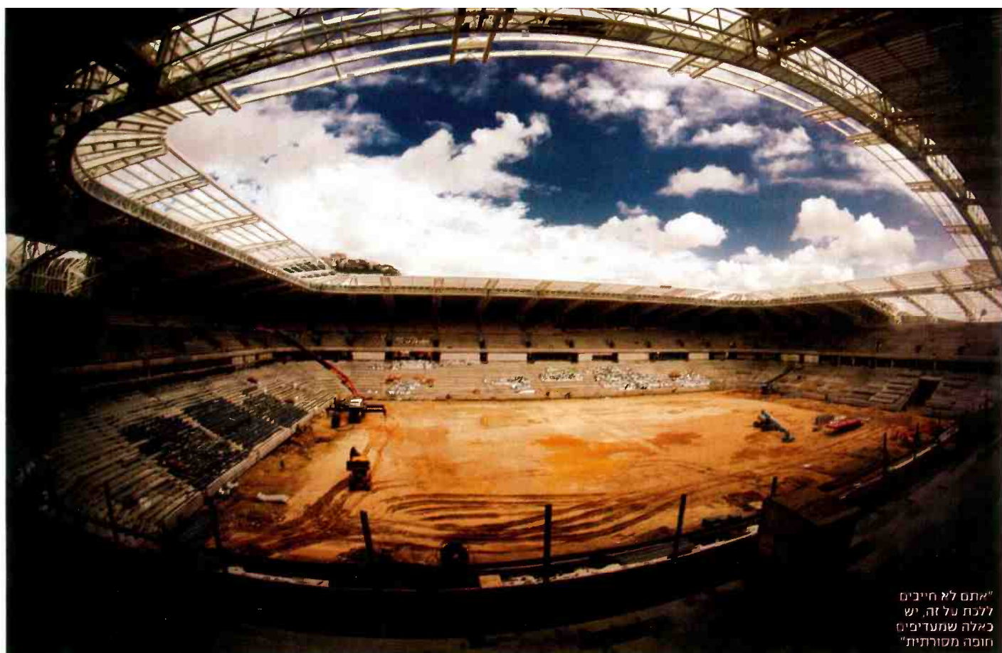
"אתם לא חייבים ללכת על זה, יש כאלה שמעדיפים חופה מסורתית"