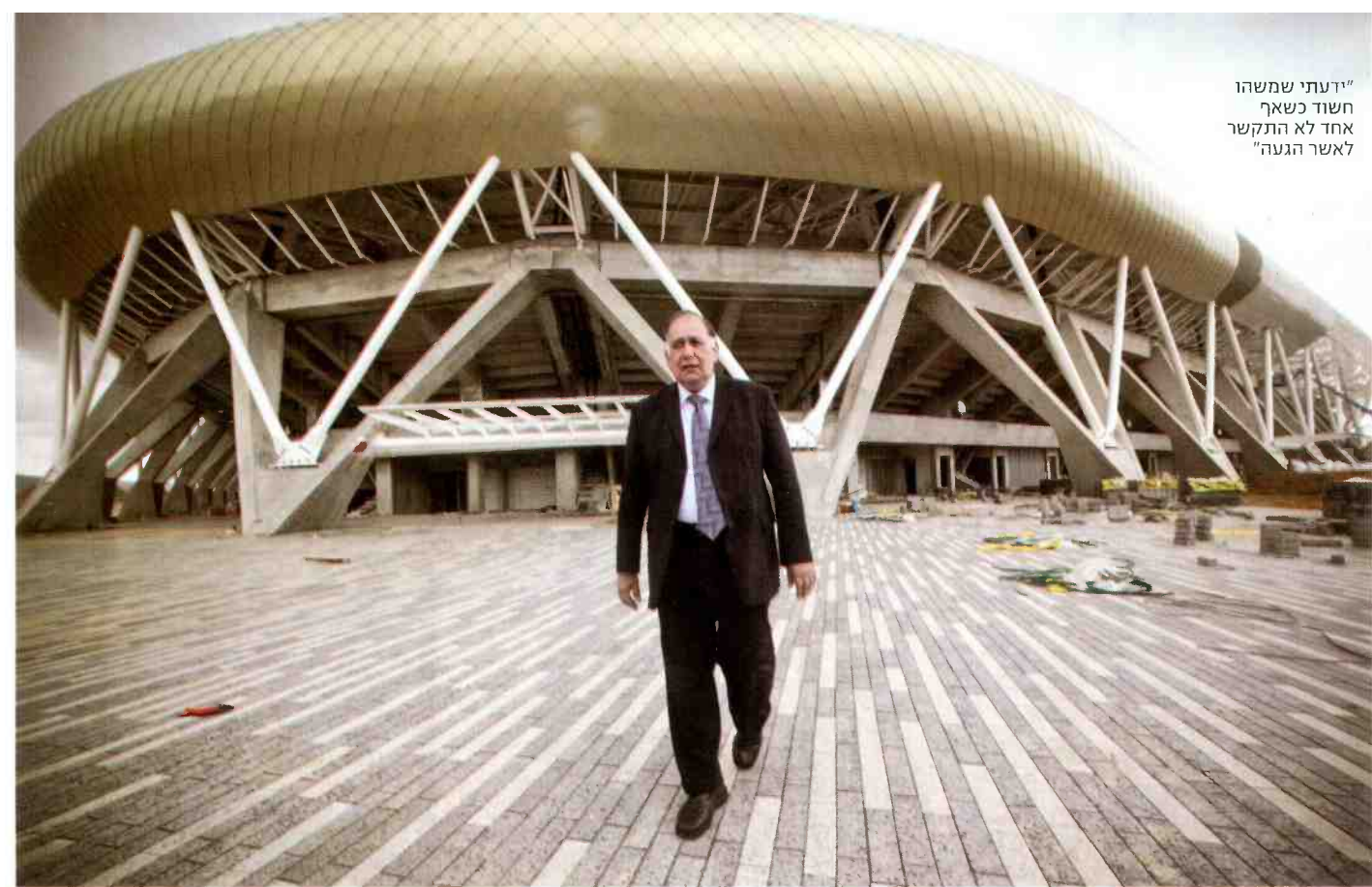
"ידעתי שמהו חשוד כשאף אחד לא התקשר לאשר הגעה"