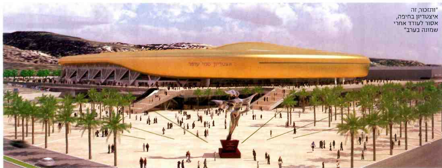
"ותזכור, זה איצטדיון בחיפה, אסור לעודד אחרי שמונה בערב"